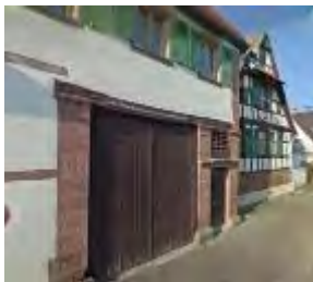
au 13 rue principale, un élément architectural remarquable