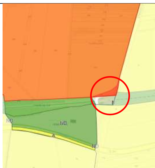
Focus sur la parcelle 04/256